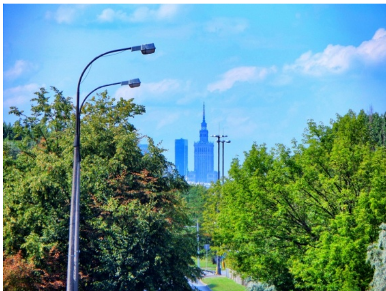
Fot. 2. Pałac Kultury i Nauki widoczny od baszt bocznych po iglicę z kładki nad ul. Sobieskiego (w okolicach ul. Iberyjskiej)

Wskazane powyżej miejsce jest jednym z niewielu punktów widokowych na Pałac od baszt bocznych po iglicę znajdujących się poza Śródmieściem. Pozostałe trzy zidentyfikowane przez autora znajdują się na stacji PKP Warszawa Zachodnia na Ochocie (choć należy zwrócić uwagę, iż zapewne ze względu na podwyższenie peronów), a także na kładkach nad ul. Sobieskiego (w okolicach skrzyżowania z ul. Iberyjską – fot. 2) oraz nad ul. Powsińską (przy skrzyżowaniu z ul. Okrężną). W Śródmieściu natomiast tego typu widok autor zauważył przy Placu Grzybowski, a także na skrzyżowaniach ul. Marszałkowskiej z ulicami Królewską oraz Nowogrodzką (czyli ich krańcach znajdujących się w pobliżu kwartału centralnego).