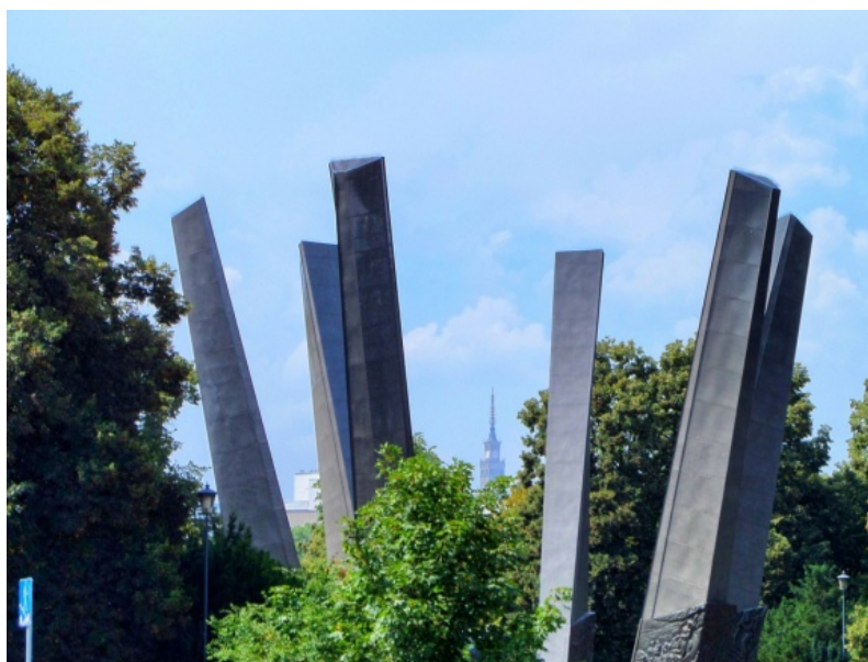
Fot. 5. Pałac Kultury i Nauki widoczny od wieżyczki po iglicę z okolic Pomnika Chwała Saperom (przy ul. Solec)

Photo 5. The view of Palace of Culture and Science from turret to spire near the Monument of Sappers' Glory (near Solec Street)