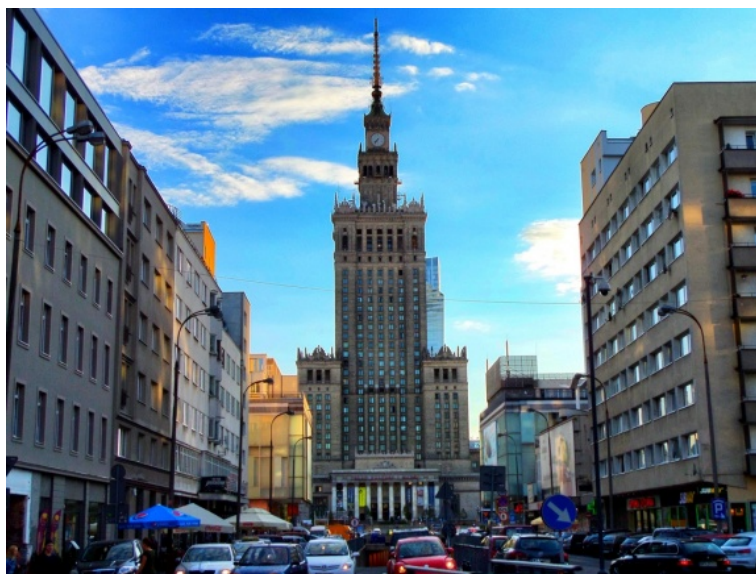
Fot. 1. Pałac Kultury i Nauki widoczny od podstawy po iglicę z ul. Złotej (po stronie wschodniej) Photo 1. The view of Palace of Culture and Science from foundation to spire on Złota Street (east side)

chmur zasłaniane są przez różnego rodzaju względnie małe obiekty, np. drzewa). Ponadto punkty, a nawet ciągi widokowe na cały PKiN (choć z przysłoniętymi bocznymi częściami podstawy) znajdują się w kanionach ul. Wallenberga, ul. Złotej (z obydwu stron budynku) oraz ul. Pankiewicza. Ich krańce od strony tego budynku to bez wątpienia jedne z najbardziej spektakularnych otwarć widokowych na PKiN. Walory tych ulicznych ciągów widokowych zostały na tyle docenione, że znajdujące się tam otwarcia widokowe objęto ochroną prawną poprzez zapisy planu miejscowego z 2010 roku 5 (zaktualizowanego w 2014 r. 6 ). Otwarcia co prawda zostały objęte ochroną, jednak całe osie widokowe niestety nie. Widoki na Pałac w całej okazałości znajdowały się nie tylko na krańcach ul. Złotej od strony budynku (fot. 1), ale także w dalszej części tej ulicy aż do skrzyżowania z ul. Żelazną (tam widać Pałac od podstawy po iglicę, lecz nieco przysłonięty przez wieżowiec Żłota 44) oraz w ciągu ulicznym Złota-Przeskok-Górskiego. Tam widok na Pałac został w dość dużym stopniu zaburzony przez budowę w 2015 roku biurowca Astoria na rogu ul. Przeskok i ul. Szpitalnej. O bezpowrotnej utracie w kompozycji urbanistycznej Warszawy tej wyjątkowej osi widokowej zakończonej okazałą bryłą Pałacu Kultury i Nauki pisał m.in. reportażysta Filip Springer (2015) 7 .