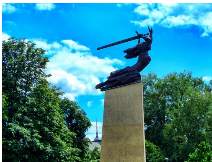
Fot. 7. Iglica Pałacu Kultury i Nauki widoczna z okolic Pomnika Bohaterów Warszawy (przy ul. Kapucyńskiej) Photo 7. The view of Palace of Culture and Science's spire near the Monument of Warsaw Heroes (from Kapucyńska Street)