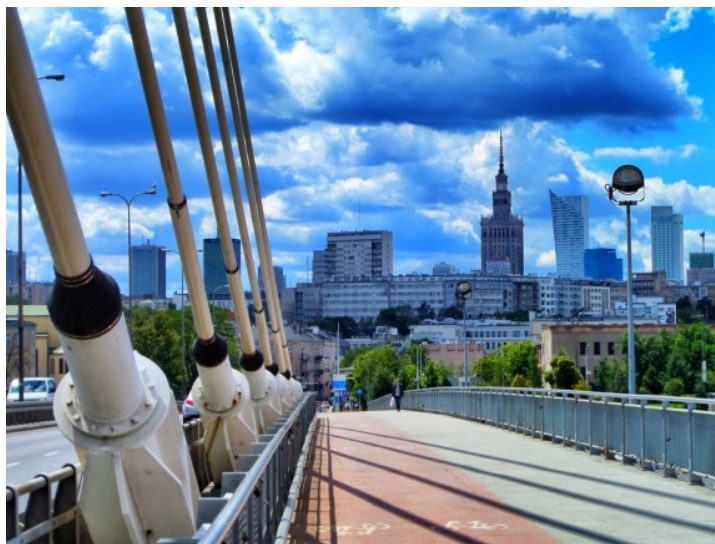
Fot. 3. Pałac Kultury i Nauki widoczny od korpusu głównego po iglicę z Mostu Świętokrzyskiego Photo 3. The view of Palace of Culture and Science from main trunk to spire from Świętokrzyski Bridge

Fieldorfa „Nila”, al. Waszyngtona z ul. Lipską (Praga-Południe), z Plaży „ZOO”, ze skrzyżowania ul. Wybrzeże Kościuszkowskie z ul. Okrzei, w okolicach Portu Praskiego, ze stacji PKP Warszawa Wschodnia (Praga-Północ), na skrzyżowaniach ul. Sobieskiego z ulicami Idzikowskiego, Mangalii, Sikorskiego, ul. Powsińskiej z ul. św. Bonicafego (Mokotów), na skrzyżowaniach ul. Kasprzaka z licznymi ulicami na Woli (m.in. z Karolkową, Skierniewicką, Płocką, Bema, Ordoną, al. Prymasa Tysiąclecia), na skrzyżowaniach ul. Czecha z ulicami Wierchowskiego i Wawerską oraz na początku Traktu Brzeskiego (Wawer), a także w okolicach Kanału Żerańskiego (Białołęka). Korpus główny Pałacu ujrzyć można także z kilku mostów: Siekierkowskiego, Gdańskiego, Świętokrzyskiego (fot. 3), Poniatowskiego, Śląsko-Dąbrowskiego oraz Grota-Roweckiego, a także kładek nad ul. Sobieskiego na Mokotowie (np. tej w okolicach ul. Czarnomorskiej) czy nad ul. Ostrobramską przy ul. Grenadierów (Praga-Południe). Nietuzinkowy punkt widokowy na całe centrum Warszawy wraz z Pałacem (od korpusu głównego wzwyż) znajduje się przy ul. Kalorycznej na Mokotowie przy ogródkach działkowych, gdzie ten imponujący widok stanowi tło dla łąki na Siekierkach.