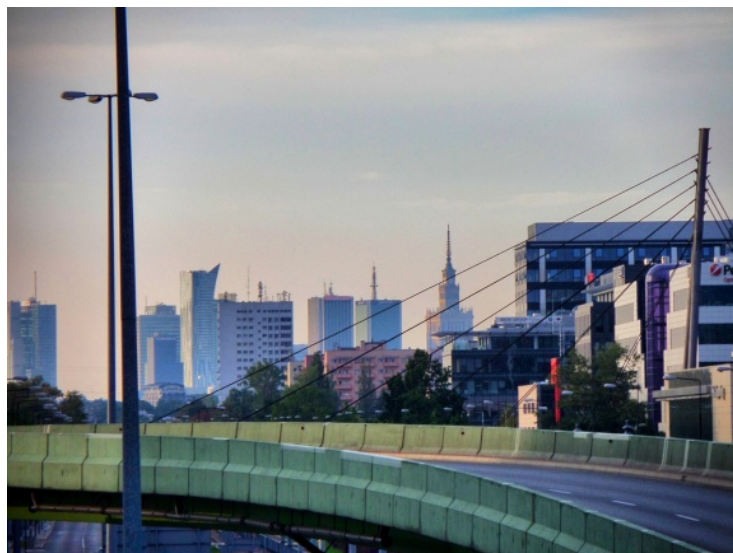
Fot. 4. Pałac Kultury i Nauki widoczny od tarasu widokowego po iglicę z kładki nad ul. Rzymowskiego (okolice ul. Cybernetyki)

mnianych wcześniej arterii komunikacyjnych (m.in. al. Jana Pawła II, ul. Powsińskiej, Al. Jerozolimskich) z mniejszymi ulicami. Ta część Pałacu widoczna jest także z jednej z granic administracyjnych Warszawy – w okolicach skrzyżowaniu ul. Górczewskiej z ul. Lazurową (Bemowo).