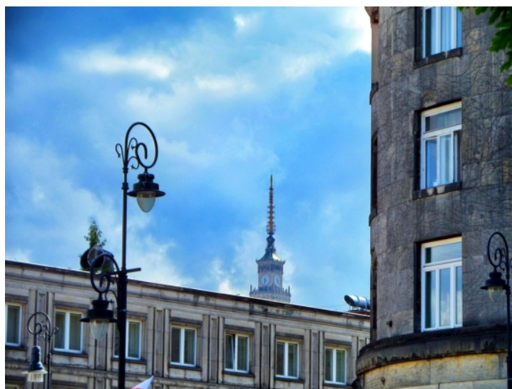
Fot. 6. Pałac Kultury i Nauki widoczny od wieży zegarowej po iglicę ze skrzyżowania ul. Krakowskie Przedmieście z ul. Królewską

Photo 6. The view of Palace of Culture and Science from clock tower to spire from junction of Krakowskie Przedmieście Street and Królewska Street