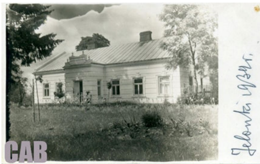
Fot. 2. Pocztówka z okresu funkcjonowania Miasta Ogrodu Jelonek, z napisem „Jelonek 1934”

okolicznych zakładów, takich jak gazownia czy elektrownia, a także kolejarzy i urzędników. Całości koncepcji nie udało się zrealizować. Dziś główną pozostałością po mieście ogrodzie jest układ ulic na obszarze położonym na wschód od ulicy Powstańców Śląskich. Jednym z nielicznych zachowanych ostańców zabudowy tamtego okresu jest drewniany dom położony przy ulicy Oświatowej 5 , w sąsiedztwie skrzyżowania z ulicą Człuchowską. W przeciwieństwie do większości tego typu budynków nie został on wyburzony ani przebudowany po II wojnie światowej, przez co stanowi unikat w skali Jelonek. O przedwojennej historii miasta ogrodu świadczą również liczne, rosnące między budynkami drzewa owocowe (Trybuś 2011, s. 175; http://cab.waw.pl/bemowo-z-przewodnikiem-gdzie-jest-miasto-ogrod-jelonek/ , dostęp: 27.01.2023; https://tustolica.pl/zycie-przed-wielka-plyta-czyli-skad-sie-wziely-jelonek_74363 ; https://mapa.um.warszawa.pl/mapaApp1/mapa?service=zielen ).