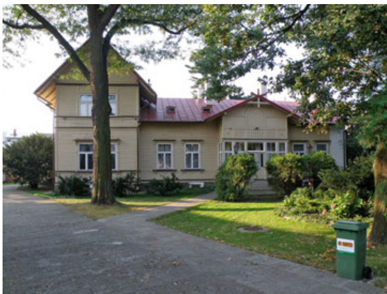
Fot. 1. Willa Schneiderów – widok współczesny