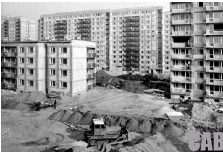
Fot. 6. Budowa osiedla Lazurowa, 1977 r.

przecinające ją ciągi piesze obsadzone zielenią. Tu znajdowały się pawilony i stoiska handlowe, przychodnia, a także poczta – przez wiele lat jedyna na Jelonkach (Trybuś 2011, s. 175, 183). Mieszkania na osiedlu Lazurowa charakteryzowały się stosunkowo dużym, jak na ówczesne standardy mieszkaniowe Warszawy, metrażem – średnio 54 m 2 ( http://cargocollective.com/powojennymodernizm/Jelonki ).