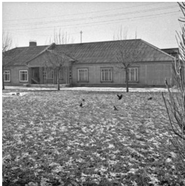
Fot. 3. Przykład pawilonu w stylu dworcowym na osiedlu „Przyjaźń”, 1961 r.

ratusz dzielnicy Bemowo. Znajdują się one w narożniku ulic Górczewskiej i Powstańców Śląskich. W dawnym kinie natomiast powstała popularna wśród najmłodszych mieszkańców sala zabaw Kolorado. Obecnie Osiedlem Akademickim „Przyjaźń” zarządza Akademia Pedagogiki Specjalnej im. Marii Grzegorzewskiej ( https://osiedleprzyjazn.pl/historia/ , dostęp: 28.01.2023; Trybuś 2011, s. 186–187).