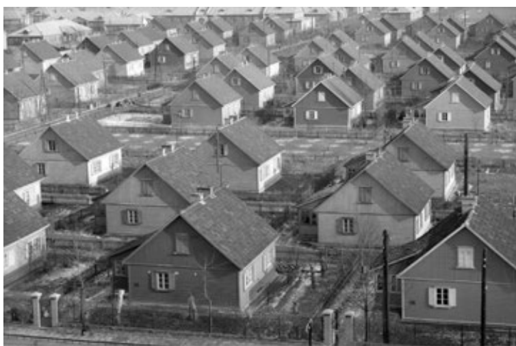
Fot. 4. Domy jednorodzinne na osiedlu „Przyjaźń”, 1961 r.