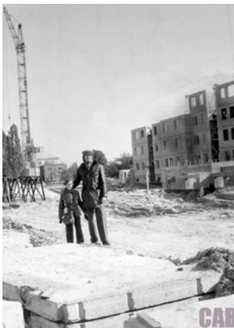
Fot. 7. Budowa osiedla Górczewska – ulica Legendy, 1979 r.

Na południowo-wschodnim krańcu osiedla Górczewska, u zbiegu ulic Powstańców Śląskich i Człuchowskiej, naprzeciwko Hali Targowej Wola, przewidywano utworzenie centrum Jelonek. Planowano budowę kina, poczty, domu społecznego, hali sportowej z basenem oraz pawilonów handlowych. Założenia tego nie udało się zrealizować. Po 1989 roku w tym miejscu powstał bazar (będący niejako przedłużeniem targowiska funkcjonującego wokół Hali Targowej Wola), który na początku XXI wieku został zastąpiony blokami mieszkalnymi (Trybuś 2011, s. 176, 184). Do pomysłu utworzenia w sąsiedztwie Hali Targowej Wola lokalnego centrum powrócono w 2015 roku w koncepcji stworzonej przez Oddział Warszawski Stowarzyszenia Architektów Polskich na zlecenie stołecznego ratusza 11 (Studium koncepcyjne dotyczące centrów lokalnych w Warszawie, 2015).