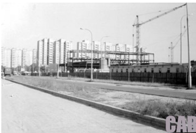
Fot. 5. Budowa Hali Targowej Wola, w tle bloki osiedla Jelonki, 1979 r.